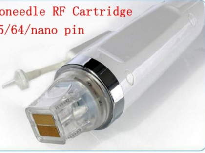
Microneedle RF Cartridge 10/25/64/nano pin